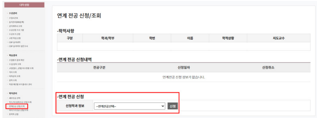
<연계전공 신청화면 예시>