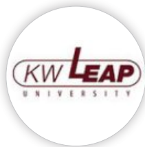
대학혁신지원사업 자율협약대학 선정