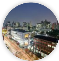
서울시 캠퍼스타운 조성사업 선정