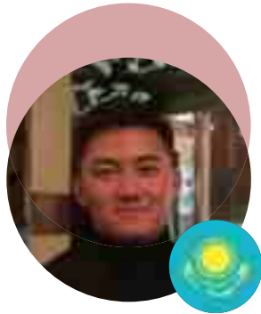
Khoa Tiếng Anh Doanh Nghiệp khoá 19 Ten Alexander, Kazakhstan