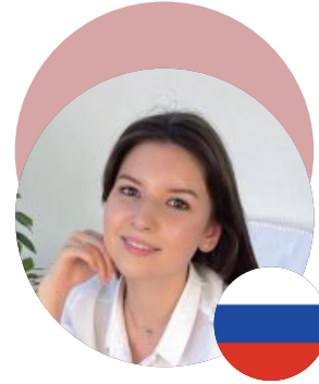
국어국문학과 19학번 러시아 아이굴