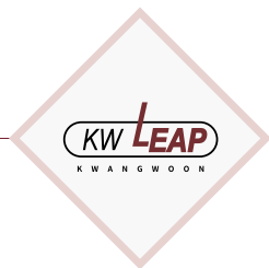
Университет добровольно поддерживает программу инноваций в сфере Образования