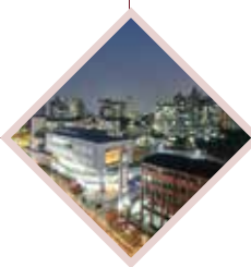
Часть проекта «кампус Сеула»