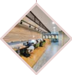
Центральная библиотека, оснащенная новейшими ICT-технологиями