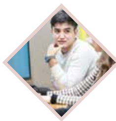
Университет, ориентированный на «SW»